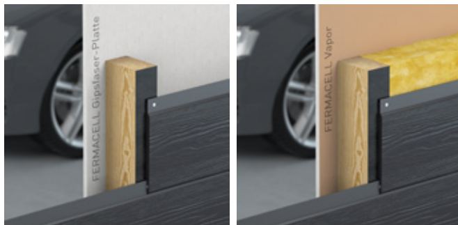
Skladba bez izolace